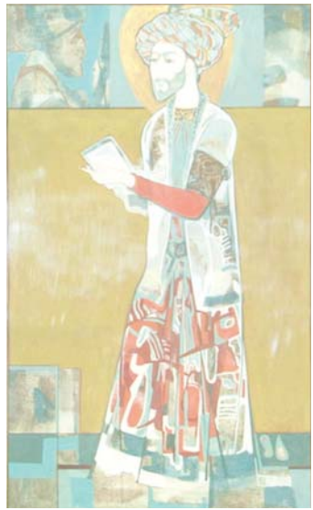
Шоҳ ва шоир З.М.Бобур (2005).