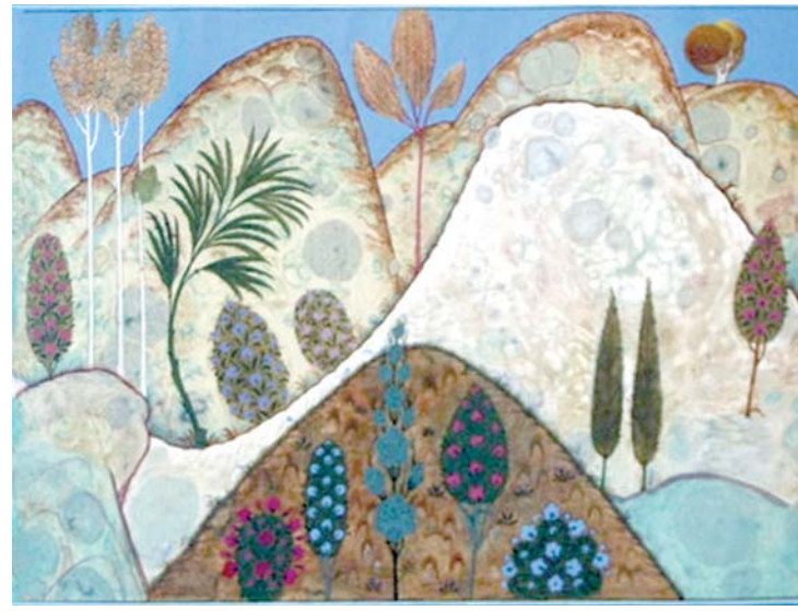
Тоғ манзараси (2008).