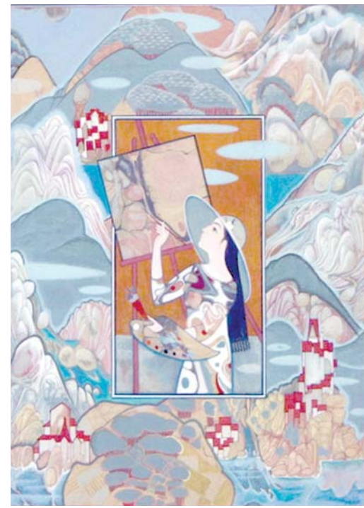
Тоғ ҳаёли (2008).