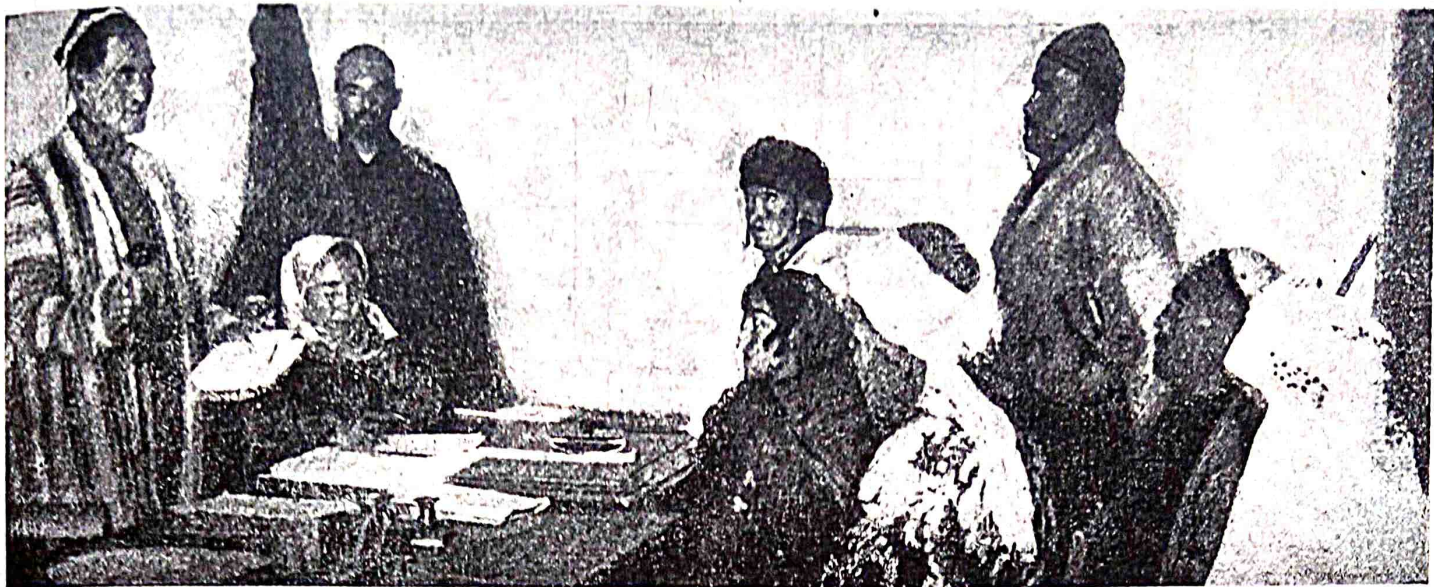
dəhqanlar qoşeb qomıta rəhbəri bilən musaxəbə qılşadılar.