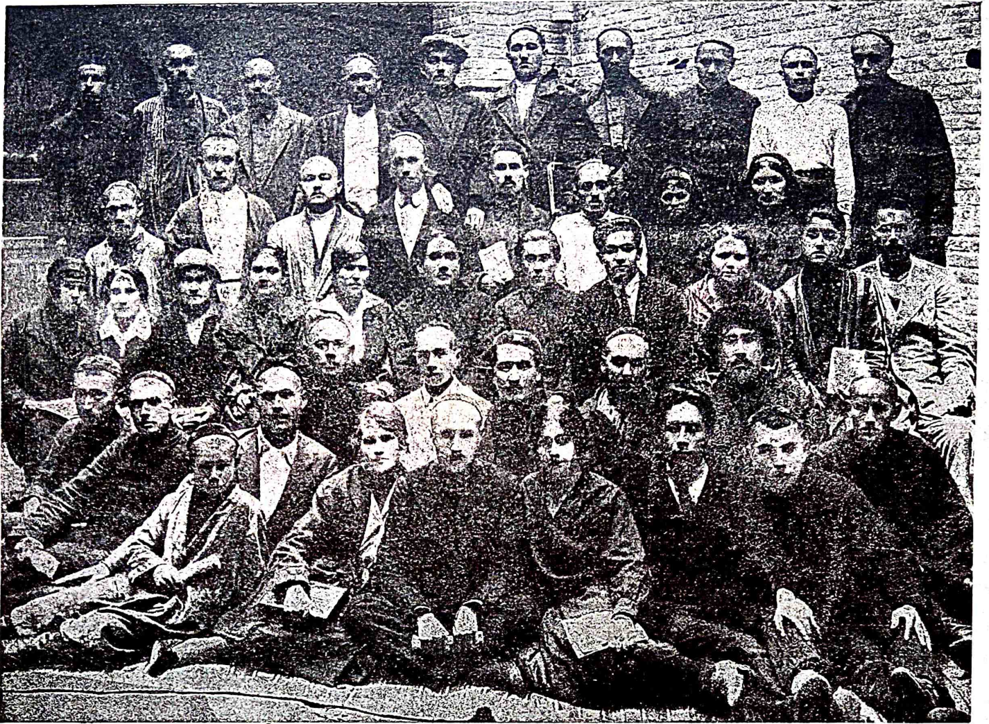
səmərqənddə myəlimlər üçyn açılqan jəngi əlifbe kypsi.