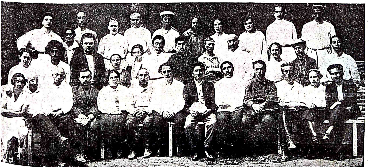
latınca örgəngən jumuşçilərimiz.

—taqdırnə təvdil qılıv voladıtm—dişsiz?—degən çavavnə qarşısçjadə çalçja verdi