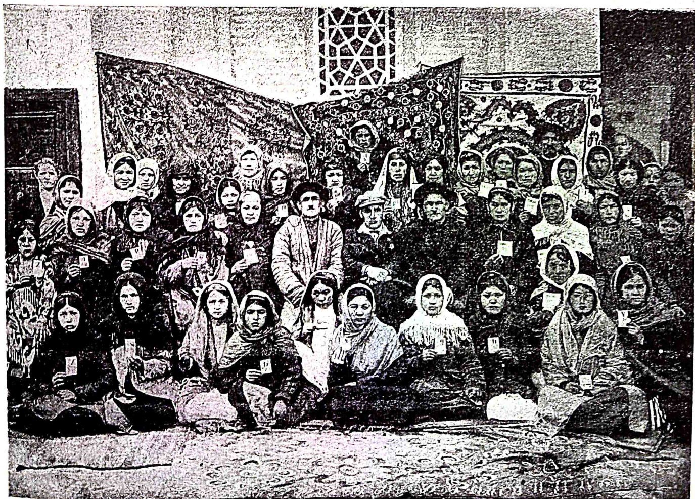
səmərqənddə latın xurufat kursini bitirən xatın-qəzlar.