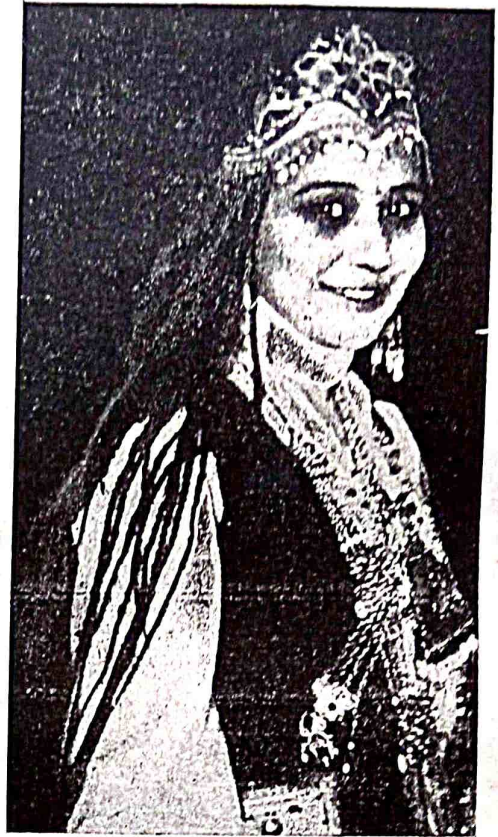
tursun aj „xəljmə“ rolьda.

u ilan pərdələni kijməsdən, „taza faxьş əjlarin bezətməsdən, jerdən ymid yəyn cecək yzğən, u“ həvəsidə“ civin qadar kьcsiz, mədə sevgən xatьn eməs, „bir qız. sen edin, şybhəsiz, u dilbər qız!... ej hajət qalьbьda janarjulduz. cynki fəbrikdə pərrə janьlьq sen, tinməjin, carcamasdan işləjsen, cəşmələr singəri, aqьv şe'rlər, təşnə dillərgə em baqьşlajsan. məj, qadahlar bilen əpişməsdən, uca baqqan tiləkkə taş atasan. jər julduzь, erk julduzь sensin. sen taңda, qızьl taңda şafaq sin.