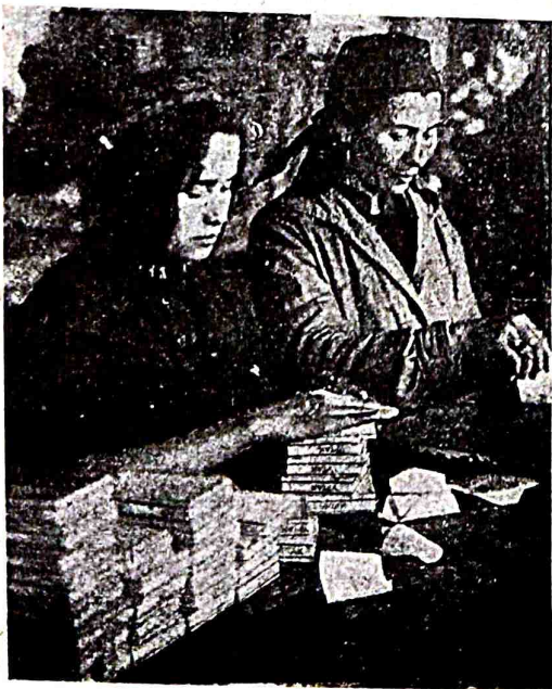
özpek işçi xatьnlarь fəbrikdə.

kycli, ceksiz deñiz qucaqılda, ömriniñ lalazar baharında, jəni turmuş, kyrəşdən örgylgən, hər qadamda zəfər bilən kылgən, ej gözəl qız! qolumda altın saz, tьnlaqьn!... sajrataj kənyldən raz. saf, gözəl bir nahar edi, turdım, qolqa bir aq varaq, qalam aldım, tьşinərkən, şu jaş xajalьmda, nurlь bir səhnə, çanlı kərtinə, keldi, raqs etdi, kyldi roхьmoqa, inçə tьtraq berib vьçydingə. unda bir qahraman tьvənlərdən, jəksəliv qan bulaqlь jerlərdən, kyldi, mehnət kyrəşi kəvi kyldi!... iş bilən qollarь qьzarqandь. u nəfis saclarь uzun—məjdə öryliv, arqaoqa təşəlgəndi. „nurlь“ parьzda vaj xatьnlardek,