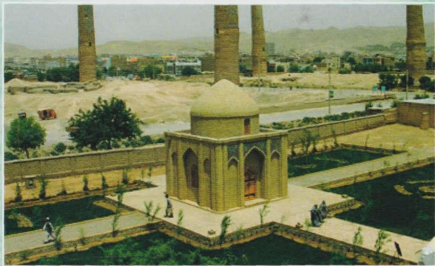
Alisher Navoiy maqbarasi (Hirot)