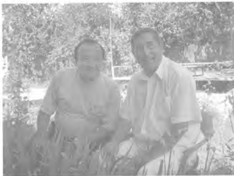
Ўзбекистон халқ артисти Эркин Комилов билан. Дурмон, 2006 йил