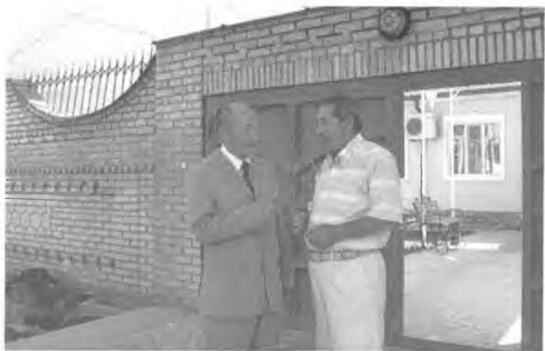
Ўзбекистон Қаҳрамони Абдулла Орипов билан. Дурмон, 2006 йил