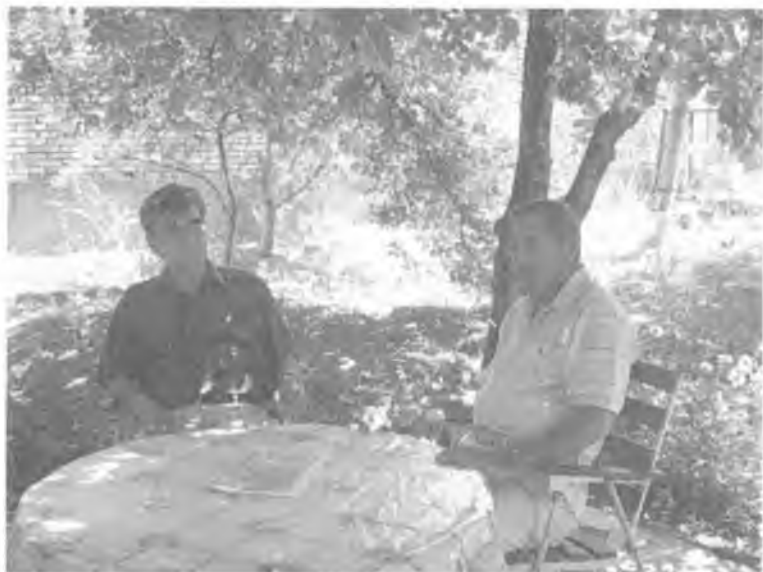
Ўзбекистон халқ шоири Усмон Азим билан. Дурмон, 2006 йил