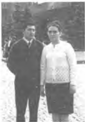
Рафиқаси Раъно билан, Москва, 1967 йил