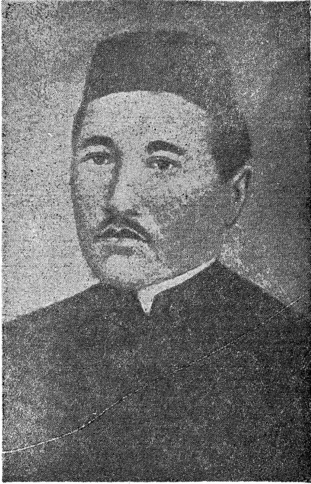
Resim 4 — MİR YAKUB DULAT