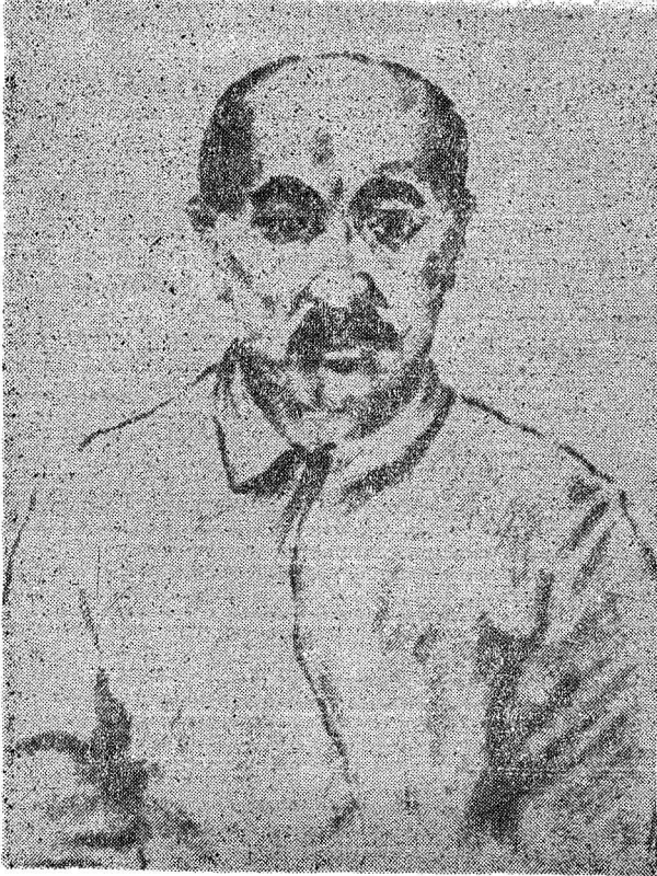
Resim 1 — ABDUL RAUF FİTRET

Rejim için tehlikeli görülen, milli hislerinden hayatlarının sonuna kadar vazgeçmeyen ve öldürülen hürriyetçi şairler arasında aşağıdakiler Türkistan edebî hayatında ayrıca itibar kazanmışlardır :